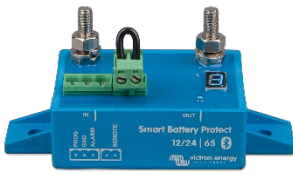
Smart BatteryProtect BP-65