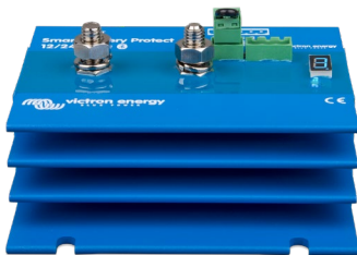
Smart BatteryProtect BP-220