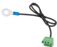
Stecker mit vormontiertem DC-Minus-Kabel (mitgeliefert)