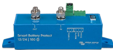
Smart BatteryProtect BP-100